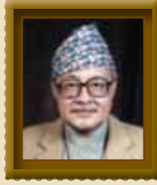
पाल हिमालय शम्शेर ज.ब.राणा चोहो चुनाव पर्यवेक्षण प्रतिष्ठान (चुप) – अध्यक्ष