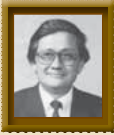
पाल कुसुम श्रेष्ठ मुल्मी नेपाल कानुन समाज – चोहो